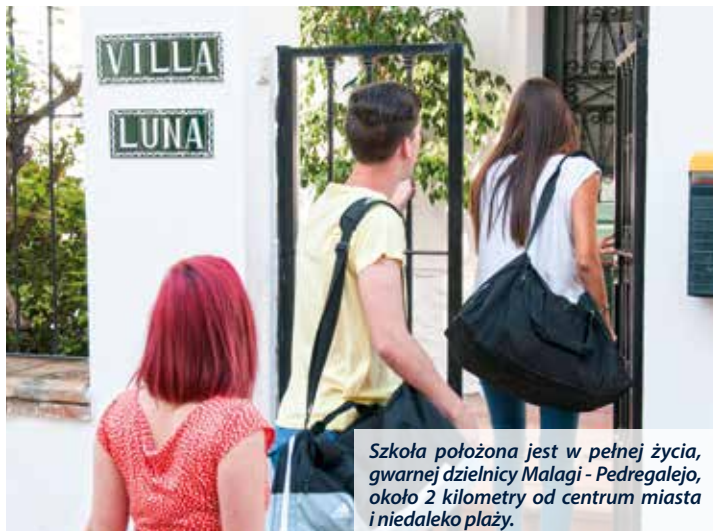
Szkola położona jest w pełnej życia, gwarnej dzielnicy Malagi - Pedregalejo, około 2 kilometry od centrum miasta i niedaleko plaży.