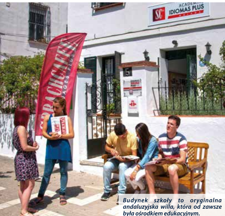
Budynek szkoły to oryginalna andaluzyjska willa, która od zawsze była ośrodkiem edukacyjnym.

Costa del Sol to ulubiona letnia destynacja wielu Europejczyków, gwarantująca piękną pogodę przez cały rok.