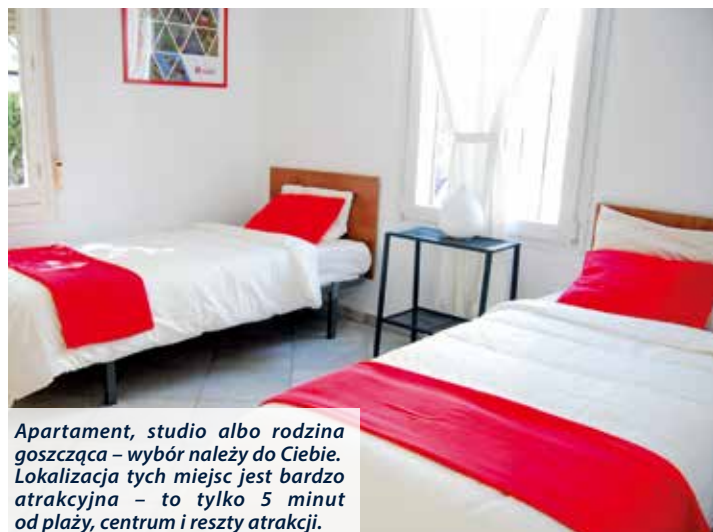
Apartament, studio albo rodzina goszcząca – wybór należy do Ciebie. Lokalizacja tych miejsc jest bardzo atrakcyjna – to tylko 5 minut od plaży, centrum i reszty atrakcji.