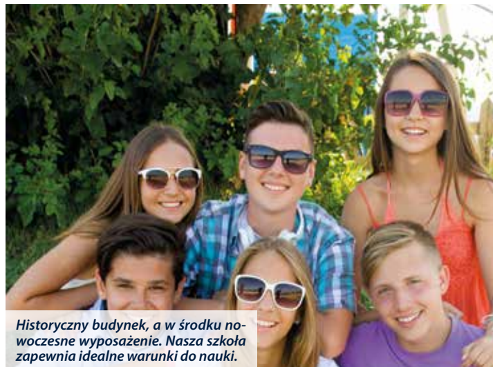
Historyczny budynek, a w środku nowoczesne wyposażenie. Nasza szkoła zapewnia idealne warunki do nauki.

W Maladze z pewnością dużo czasu będziesz spędzał na plaży. Warto jednak odwiedzić też takie miejsca jak Muzeum Picassa czy skorzystać z rejsu statkiem!